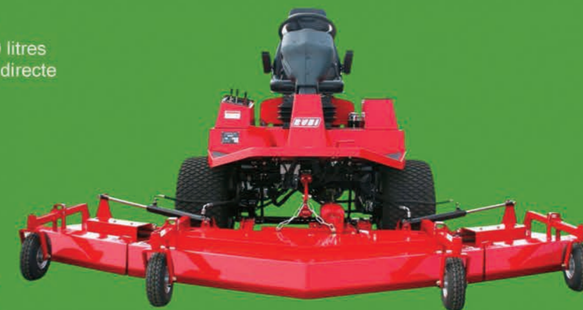
Unité de coupe jusque 3 m. avec relevage hydraulique

Les tondeuses professionnelles RUBI de Nouvelle Génération offrent une accessibilité inégalée à tous les organes moteur et hydrauliques. Une simplicité d'intervention pour tous les entretiens courants vous garantit les coûts de maintenance les plus bas et les durées d'immobilisation les plus courtes. La standardisation de nombreuses pièces détachées favorise un service après-vente rapide et économique.