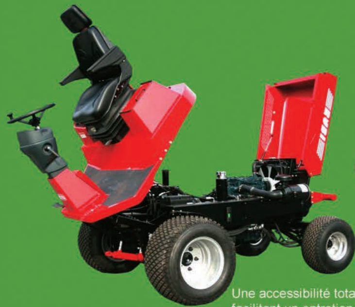
Une accessibilité totale facilitant un entretien rapide