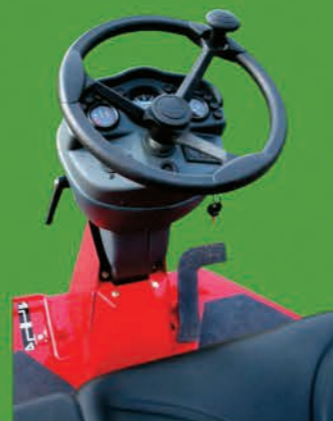
Colonne de direction réglable Tableau de bord complet Volant ergonomique