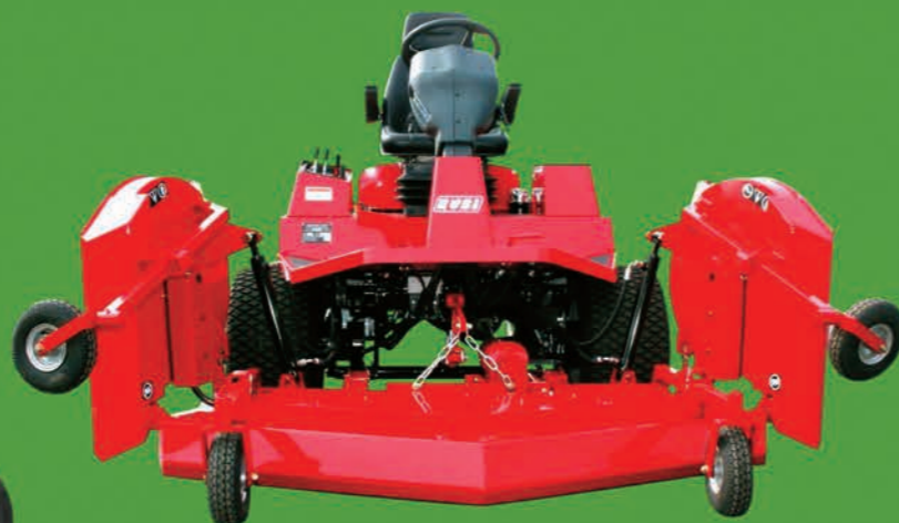
Les unités de coupe escamotables réduisent l'encombrement lors des déplacements ou le transport