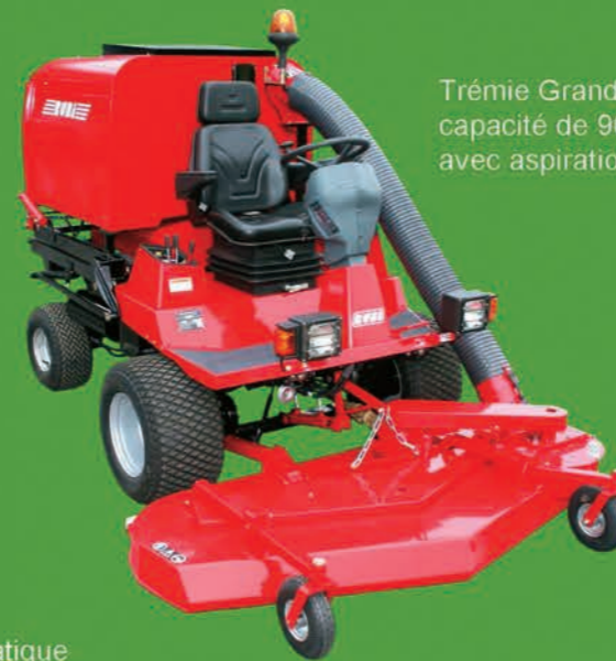
Trémie Grande capacité de 900 litres avec aspiration directe