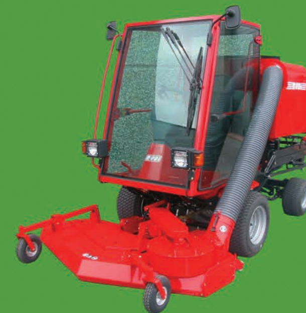
Version avec Cabine et Homologation routière

Une gamme complète adaptée à vos besoins et vos exigences Motorisation de 21 à 38 cv. Entraînement hydrostatique Largeur de coupe de 1,24 à 3,00 m. Coupe avec éjection latérale, recyclage ou ramassage 2 ou 4 roues motrices Homologation Routes Services et Proximité Constructeur Garantie 2 ans Fabrication française