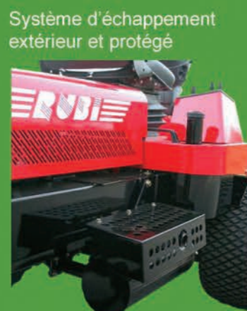
Système d'échappement extérieur et protégé