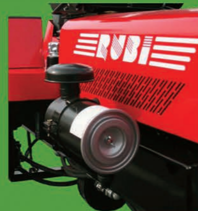
Entretien ou Remplacement du filtre à air