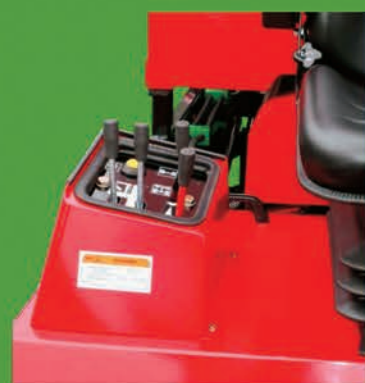
Commandes de manoeuvre simples, précises avec position adaptée au poste de conduite

Une gamme complète adaptée à vos besoins et vos exigences Motorisation de 21 à 38 cv. Entraînement hydrostatique Largeur de coupe de 1,24 à 3,00 m. Coupe avec éjection latérale, recyclage ou ramassage 2 ou 4 roues motrices Homologation Routes Services et Proximité Constructeur Garantie 2 ans Fabrication française