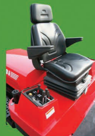
Poste de conduite sécurisé Siège réglable Grand Confort