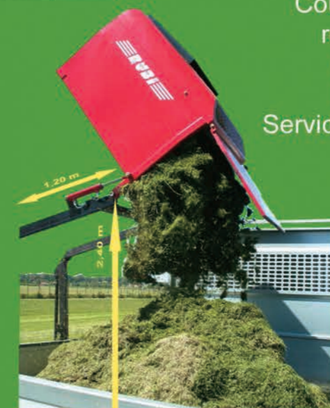
Trémie Grande Capacité. Hauteur de bannage jusqu'à 2,40 m. déport arrière de 1,20 m. pour un vidage et un transport optimisé.